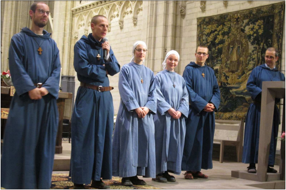
Veillée témoignage dans la basilique de Halle

église que des hommes priants. Pour cette raison, nous sommes partis dans les rues inviter les gens pour un petit temps de prière.