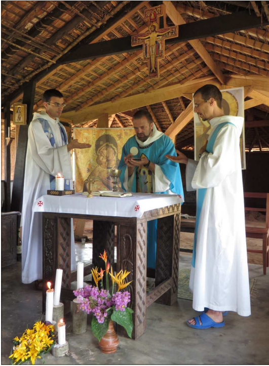
Eucharistie du 8 décembre, à la Portioncule

persévérance et le courage sur cette terre souffrante du Congo. Prions bien pour ce pays qui vit une période d'instabilité et de trouble en ces mois de préparation aux élections.