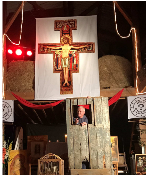
Jésus — Porte de la Vie

L'année source que nous allons vivre a pour but de cultiver davantage cette fraîcheur qui parfume nos intuitions de base. Redécouvrir avec enthousiasme notre vie à Tibériade, avec son mouvement d'une rive à l'autre. Cela a quelque chose d'inconfortable, mais c'est si beau, ce « va-et-vient » entre la vie missionnaire du moineau souple et léger et la vie toute simple, priante et laborieuse, mais exigeante, du quotidien. Pour pouvoir assumer cette dynamique, il faut prendre également le temps d'intégrer les exigences de notre vie religieuse.