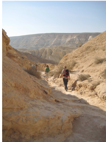
Marche dans le désert

J'ai eu la joie cet été (de mi-juillet à mi-août) de sillonner la Terre Sainte, la Bible à la main avec un groupe de pèlerins de Lyon, du mont Hermon (tout au nord) à la Mer Morte, de la Méditerranée au Jourdain : cette terre que nos pères dans la foi ont parcourue à pied (nous, c'était aussi un peu en bus !) portés par la promesse de Dieu : « Je serai avec toi ! ». Cette promesse est aussi pour nous aujourd'hui : Oui Seigneur, Tu es toujours avec nous, chacune de nos histoires est sainte. Il y aurait tellement de choses à raconter : la marche dans le désert tout sec et rocailleux, « grand et redoutable » où l'on sent la chaleur du soleil, la soif, la fatigue, le besoin de se porter les uns les autres ; le plongeon dans la Mer Rouge avec ses magnifiques coraux et des poissons de toutes les couleurs ; les sources du Jourdain avec son eau toute pure et jaillissante ; Nazareth... pour arriver enfin à Jérusalem et au