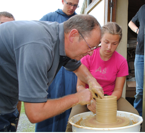
L'atelier de poterie a attiré beaucoup de jeunes pendant le camp international

vie et de vérité dans notre existence pour l'arracher aux enfermements.