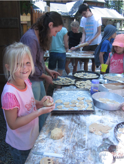
Atelier de pâtisserie lors du camp des familles

sur le mont Thabor lors de la transfiguration de Jésus. Pierre aussi venait de vivre quelque chose de fort. « Maître, il est bon que nous soyons ici ; dressons trois tentes... » (Lc 9,33).