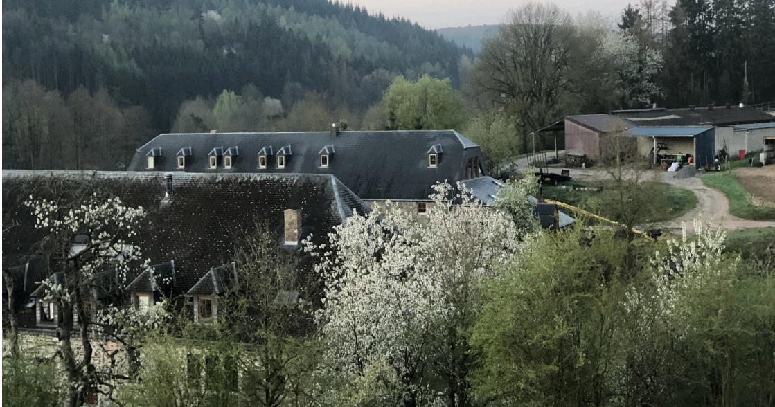
Zicht op de St. Franciscushoeve te Pondrôme, het huis van de zusters

niet bij iedereen past. Voor ons is het een kwestie van het behouden van deze grote rijkdom die ons in staat stelt te zeggen dat werkelijk alles wordt ontvangen omdat alles aan ons wordt gegeven, ook al gaat het doorheen het werk van onze handen. In die zin moeten wij goede beheerders zijn van de genade die ons is gegeven. Ontvangen en geven is een beetje als ademen voor God!