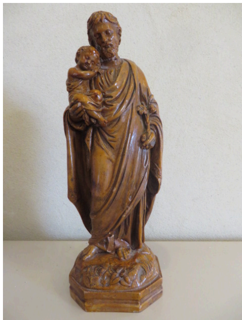
De heilige Jozef, patroon van het economaat