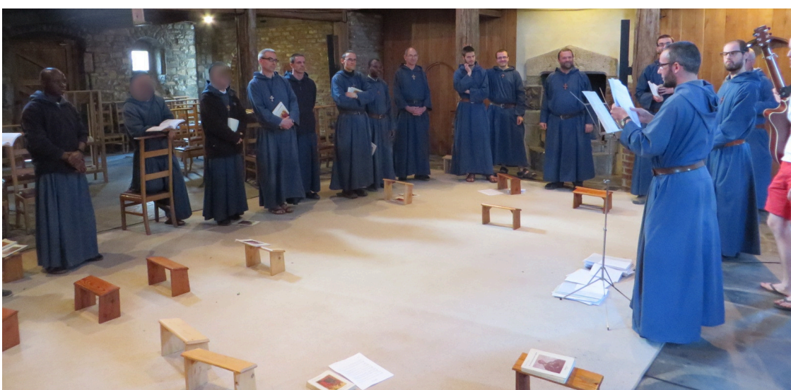
Een zangrepetitie bij de broeders