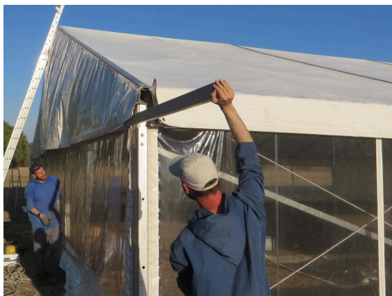
Montage van de nieuwe tent-kapel

In dezelfde zin willen wij de “start-ups” aanmoedigen. Wij merken allemaal dat het helaas moeilijk wordt om mensen die “afgehaakt” hebben terug naar de kerk te trekken. Anderzijds is het over het algemeen niet zo moeilijk op om ze bij zich thuis uit te nodigen. Deze situatie mag ons niet ontmoedigen, maar leert ons te herontdekken dat het op deze manier is dat het christelijk geloof zich heeft verspreid. In het evangelie van Lucas en de Handelingen van de Apostelen kunnen wij lezen dat Jezus en de apostelen vaak aan tafel worden uitgenodigd voor een maaltijd. De tafel is een mooi symbool van gemeenschap.