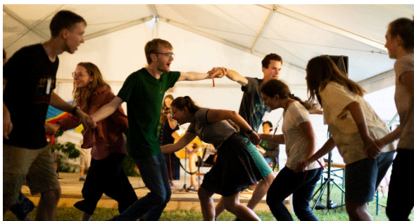
Avond met traditionele dansen

Begin juli organiseerde de Fraterniteit in Litouwen een internationaal kamp voor jongeren van 16 tot 30 jaar. De laatste keer dat er een internationaal kamp was bij onze broeders in Baltriškės was in 2012, dus al tien jaar geleden. Dit jaar waren er ongeveer 250 jongeren, uit 15 verschillende landen: Litouwen, Letland, Estland, België, Frankrijk, Tsjechië, Hongarije,... en zelfs Mexico, Canada en Australië!