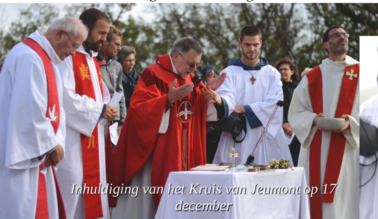
Inhuldiging van het Kruis van Jeumont op 17 december