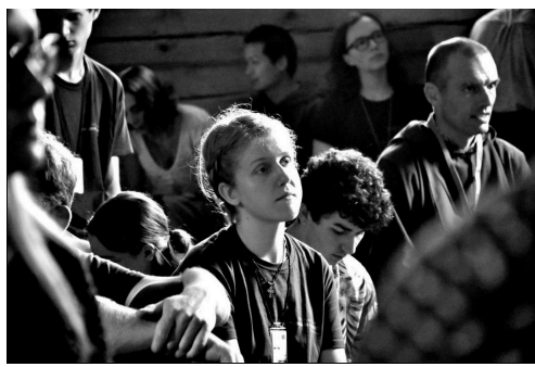
Moment in de kapel

Het kampeleven bestond uit gebedstijden, onderricht, uitwisseling, workshops, handenarbeid, getuigenissen, en natuurlijk maaltijden en vrije tijd; met de mogelijkheid om te gaan zwemmen in het nabijgelegen meer. Ik leidde persoonlijk de Bijbelworkshops met Ieva