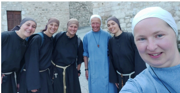
De ontmoeting met de zusters van het Kleine Testament van Sint Franciscus

Wat valt er nog meer te zeggen: Gods liefde, zijn Voorzienigheid, begeleidt ons. De landschappen zijn betoverend, vol geurige brem, weidse horizons, vlinders die aan onze voeten fladderen, kersenbomen vol met rijpe kersen, die bijna rijp zijn: we begonnen te sterven van hitte en dorst! Ik ga op de grond zitten en raap de kersen op die daar liggen, binnen handbereik. Hoe goed bent u, Heer! Op een weg die we een beetje gevaarlijk vinden, worden we “gered” en opgehaald door de bisschop van Gubbio. Bovendien vond hij voor ons onderdak voor de nacht in een nieuwe gemeenschap van vier zusters van het “ Kleine Testament van Sint Franciscus ”. De volgende dag, net toen mijn sandalen het begonnen te begeven en ik moe werd, zagen we een paar wandelschoenen aan een boom hangen bij een kapelletje van Onze Lieve Vrouw van Genade! Ik pas ze: