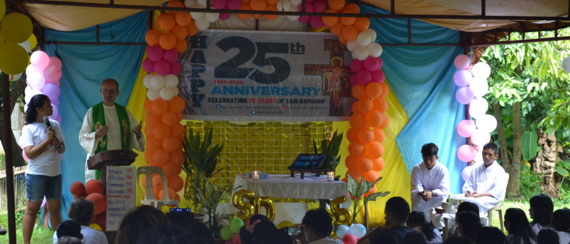
De eucharistie van het feest van 25 jaar